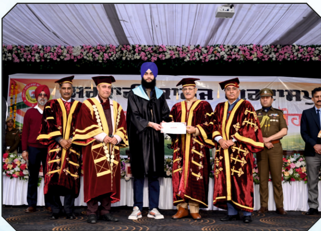
ਚੀਫ ਗੈਸਟ ਵਿਦਿਆਰਥੀਆਂ ਨੂੰ ਡਿਗਰੀਆਂ ਪ੍ਰਦਾਨ ਕਰਦੇ ਹੋਏ