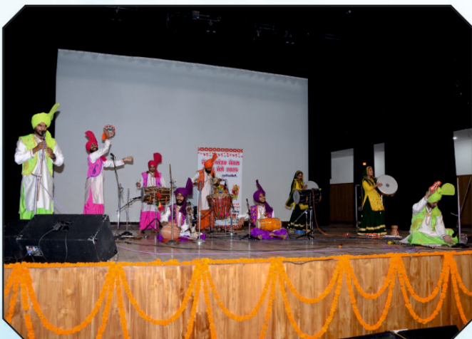
ਫੋਕ ਆਰਕੈਸਟਰਾ ਦੀ ਪੇਸ਼ਕਾਰੀ