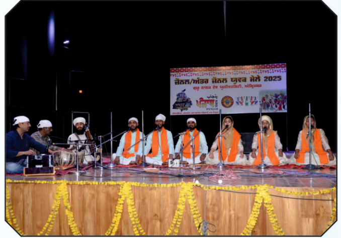
ਕਾਲਜ ਦੇ ਵਿਦਿਆਰਥੀ ਗਰੁੱਪ ਸ਼ਬਦ ਗਾਇਨ ਕਰਦੇ ਹੋਏ