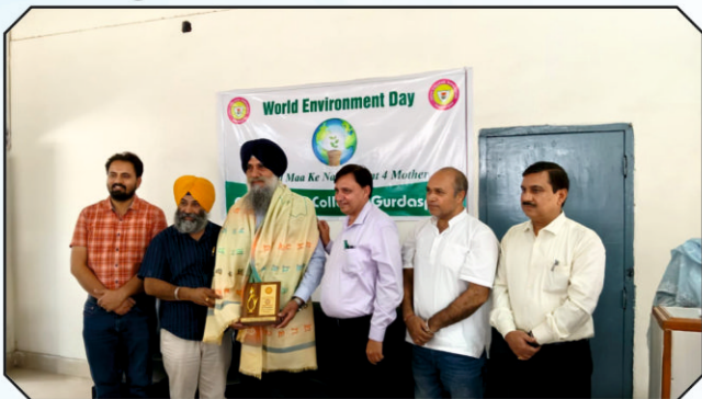
ਵਿਸ਼ਵ ਪਰਿਆਵਰਣ ਦਿਵਸ ਤੇ ਮੁੱਖ ਮਹਿਮਾਨ ਨੂੰ ਸਨਮਾਨਿਤ ਕਰਦੇ ਹੋਏ