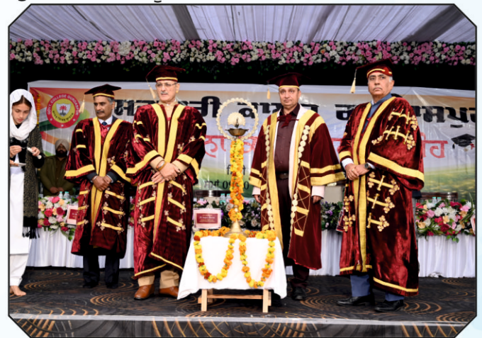
ਪ੍ਰਮੁੱਖ ਸਖਸ਼ੀਅਤਾਂ ਕਨਵੋਕੇਸ਼ਨ ਸਮਾਗਮ ਵਿੱਚ ਸ਼ਾਮਾਂ ਰੌਸ਼ਨ ਕਰਦੀਆਂ ਹੋਈਆਂ