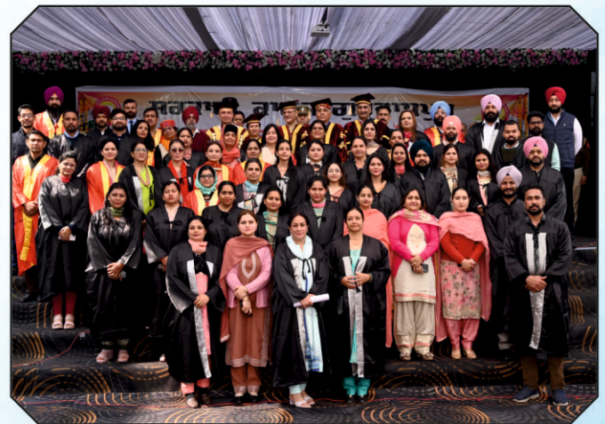
ਸ਼੍ਰੀ ਕਵਿੰਦਰ ਗੁਪਤਾ (ਲੈਫਟੀਨੈਂਟ ਗਵਰਨਰ ਲੱਦਾਖ) ਨਾਲ ਸਮੂਹ ਸਟਾਫ਼ ਦੀ ਯਾਦਗਾਰੀ ਤਸਵੀਰ