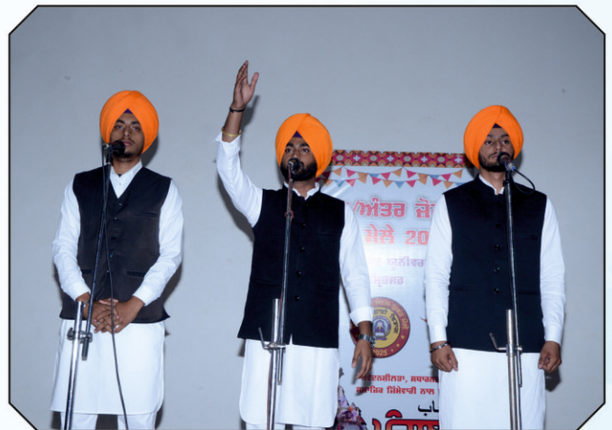
ਵਾਰ ਗਾਇਨ ਕਰਦੇ ਹੋਏ ਵਿਦਿਆਰਥੀ