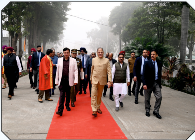
ਚੀਫ ਗੈਸਟ ਕਾਲਜ ਦਾ ਦੌਰਾ ਕਰਦੇ ਹੋਏ