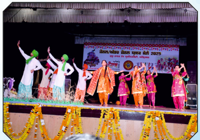
ਕੋਰੀਓਗ੍ਰਾਫੀ ਦੀ ਪੇਸ਼ਕਾਰੀ