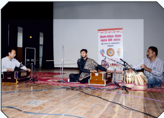
ਕਾਲਜ ਦਾ ਵਿਦਿਆਰਥੀ ਗਜ਼ਲ ਦੀ ਪੇਸ਼ਕਾਰੀ ਕਰਦਾ ਹੋਇਆ