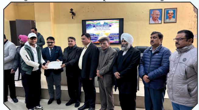
ਦੇ ਰੋਜ਼ਾ ਸਕਿਲ ਬੇਸਡ ਲੀਡਰਸ਼ਿਪ ਪ੍ਰੋਗਰਾਮ ਵਿੱਚ ਮੁੱਖ ਮਹਿਮਾਨ ਵਿਦਿਆਰਥੀਆਂ ਨੂੰ ਸਰਟੀਫਿਕੇਟ ਤਕਸੀਮ ਕਰਦੇ ਹੋਏ